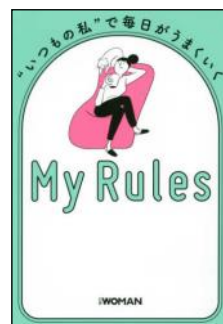
カバーデザイン：小口翔平+岩永香穂(tobufune)