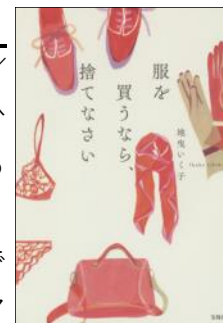
ブックデザイン：小口翔平+平山みな美(tobufune)

(地曳いく子 著/宝島社/2015年/589.2||Z 4) は、スタイリストである著者による、少ない服で素敵にみせるための服の選び方がわかる本です。赤色で描かれた美しいフォルムのファッションアイテムが並んだ、シックな印象の装丁です。服を1つ1つ手に取りながら人生の先輩にアドバイスをもらっているような気持ちをデザインからも受けます。