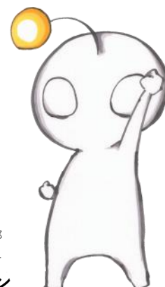
図書館ボランティア部 イメージキャラクター ライブラリアン