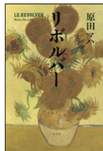
装画： フィンセント・ファン・ゴッホ 〈ひまわり〉 装丁：重実生哉

『 アフガンの息子たち 』（エーリン・ペーション著／ヘレンハルメ美穂訳／小学館／2024年／949.83||P 43）は、スウェーデンの小さな町を舞台に難民児童と施設職員の交流を描いた作品です。装画には、曇り空の下での3人の少年の姿が描かれ、恐怖や不安が感じられます。じわじわと静けさが広がるような装丁です。