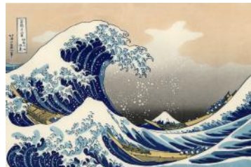
葛飾北斎 「富嶽三十六景 神奈川沖浪裏」

また、今年7月より発行の新千円札にも「富嶽三十六景 神奈川沖浪裏」が採用されているのです。私は現時点で、まだ新紙幣を手にしたことがないので、実際に見るのが楽しみです。